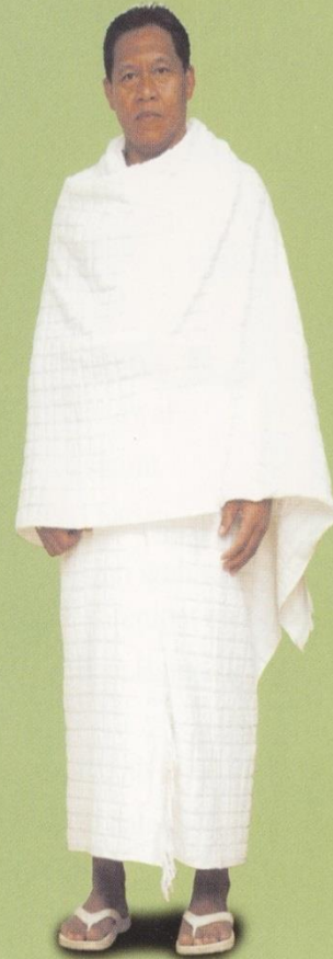
Contoh Berpakaian Ihram Lengkap Bagi Pria Di Luar Thawaf