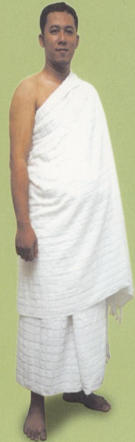
Contoh Berpakaian Ihram Lengkap Bagi Pria Ketika Thawaf