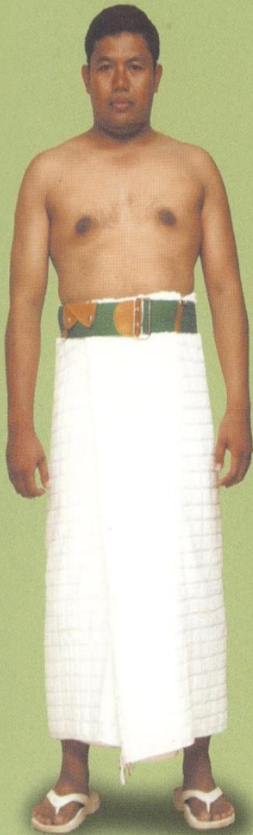
Contoh Berpakaian Ihram Bagian Bawah Bagi Pria